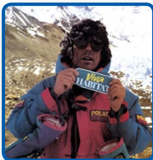
Jordi Tosas descendiendo del Cho-Oyu (Tibet) en 1997

Jordi Tosas, el alpinista español que ha llevado a lo más alto una tabla de snowboard (8.100 metros en el Everest o 8.201 metros en el Cho-Oyu) ha llevado el nombre de Viva Habitat a la cima de las principales montañas de los cinco continentes.