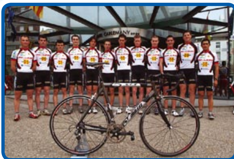
Presentación del ECP Massi (ciclismo en ruta), 2006