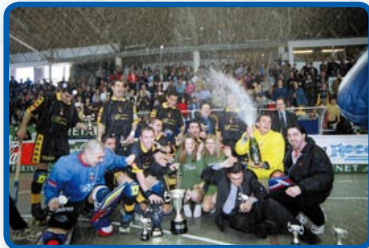
Viva Habitat Blanes en la celebración de la Copa del Rey 2001

En Blanes -localidad históricamente vinculada al deporte del hockey sobre patines-, el equipo que participa en la máxima división estatal es, desde el año 1999, Viva Habitat Blanes. Club y empresa forman desde entonces un tándem de éxito que alcanzó su mayor logro en el año 2001 con la consecución de la Copa del Rey.