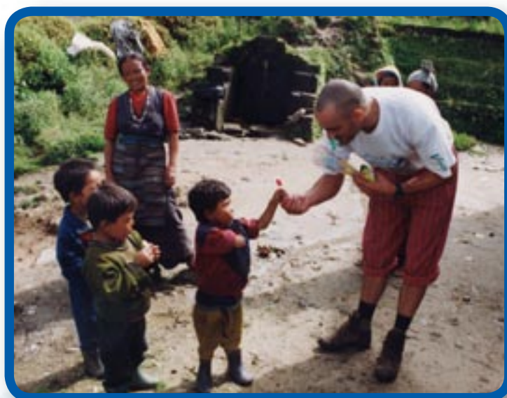
Campaña solidaria de entrega de material escolar y deportivo en Nepal. Marzo de 1999

Expediciones solidarias para llevar material escolar y deportivo a Nepal o medicinas y ropa a Kenya han encontrado un sólido apoyo en Viva Habitat.